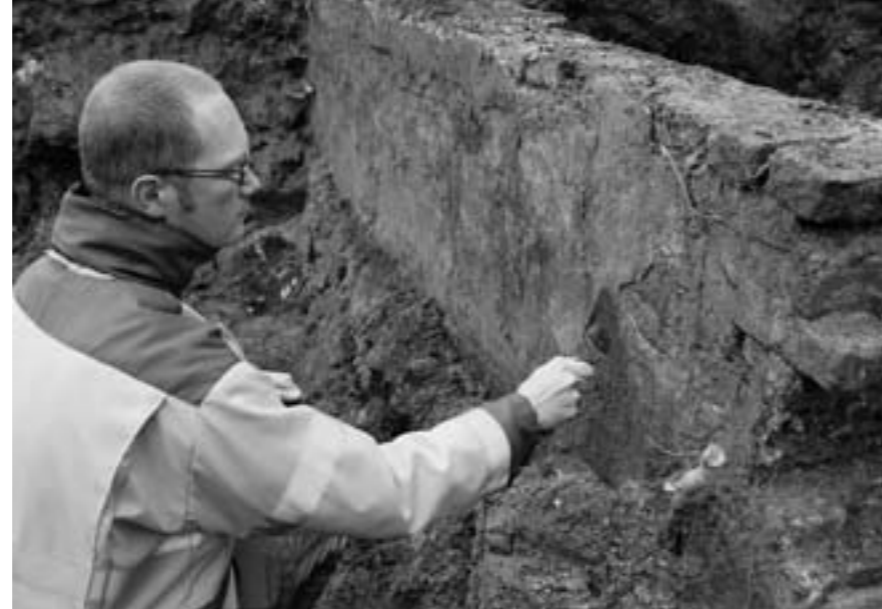
De zware kademuur waar ooit de Molenbeek langs stroomde

Een meter verder is de muur blootgelegd van het gebouw waar naar werd gezocht: de graanschuur die later is genoemd naar de 19e-eeuwse eigenaar Dullert. Naast deze muur maakt Kasper de bodem van een put voor de opslag van regenwater zichtbaar. De put zelf is lang geleden afgebroken, de bakstenen zijn destijds vanwege de hoge prijs opnieuw gebruikt.