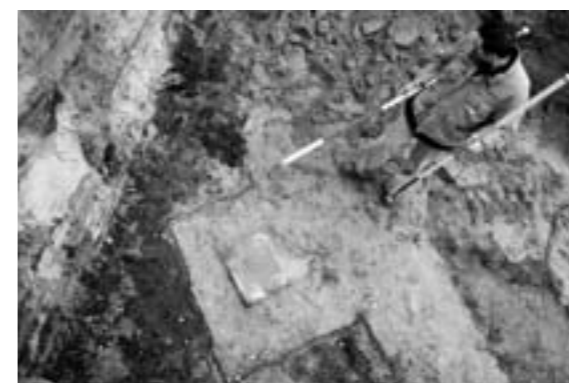
Oude boogmuren tussen de betonnen poeren van de gesloopte Dullertflat