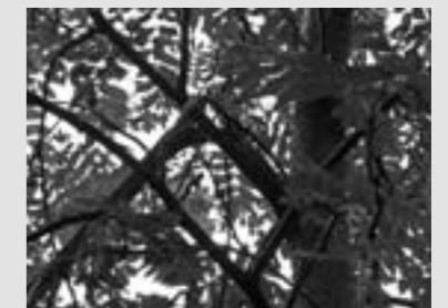
Geknakte boomtakken door toedoen van een hoogwerker