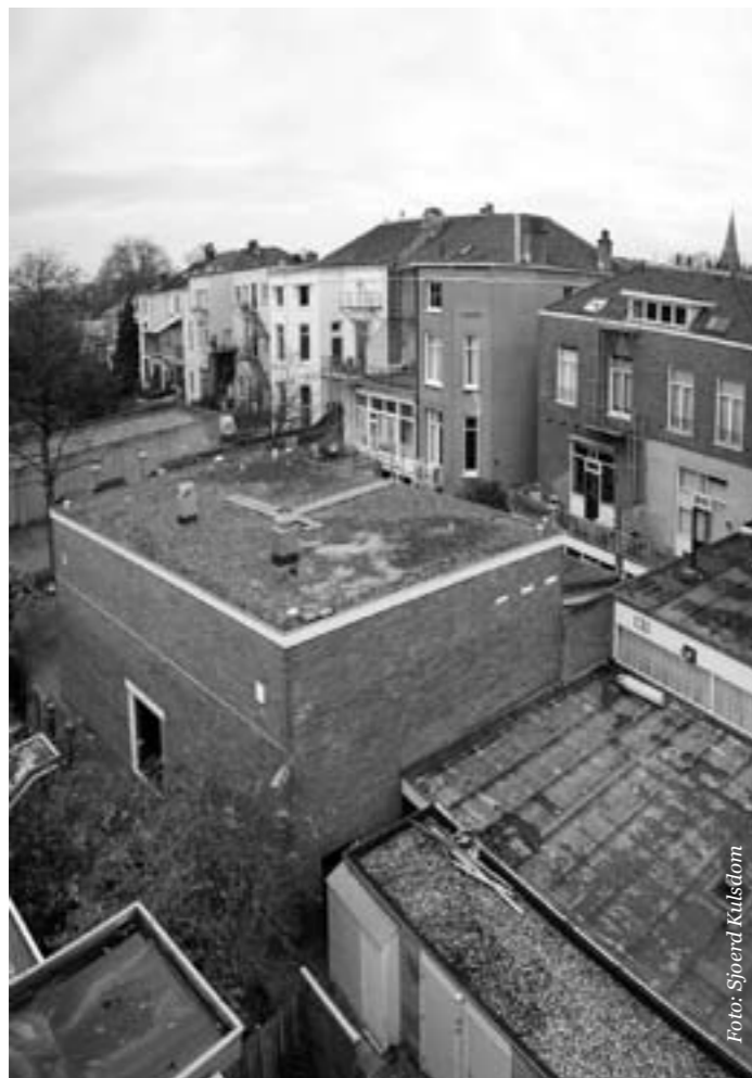
De 'toneeltoren' van het theater tussen de woningen, gezien vanaf de flat in de Dijkstraat.