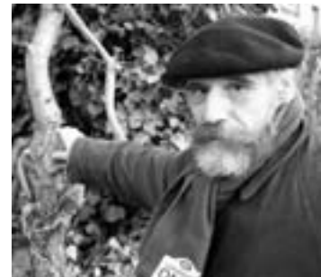
Kassiël bij de tweestijlige meidoorn ( Crataegus laevigata )