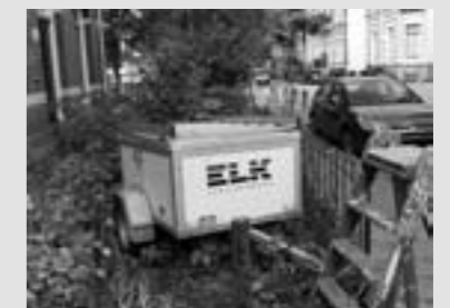
Een aanhanger wordt midden in de tuin geparkeerd