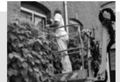
Een schilder wringt zich door de beplanting