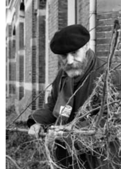
Kassiël toont de afgebroken takken

Hieronder de brief die hij de redactie van de wijkkrant stuurde.