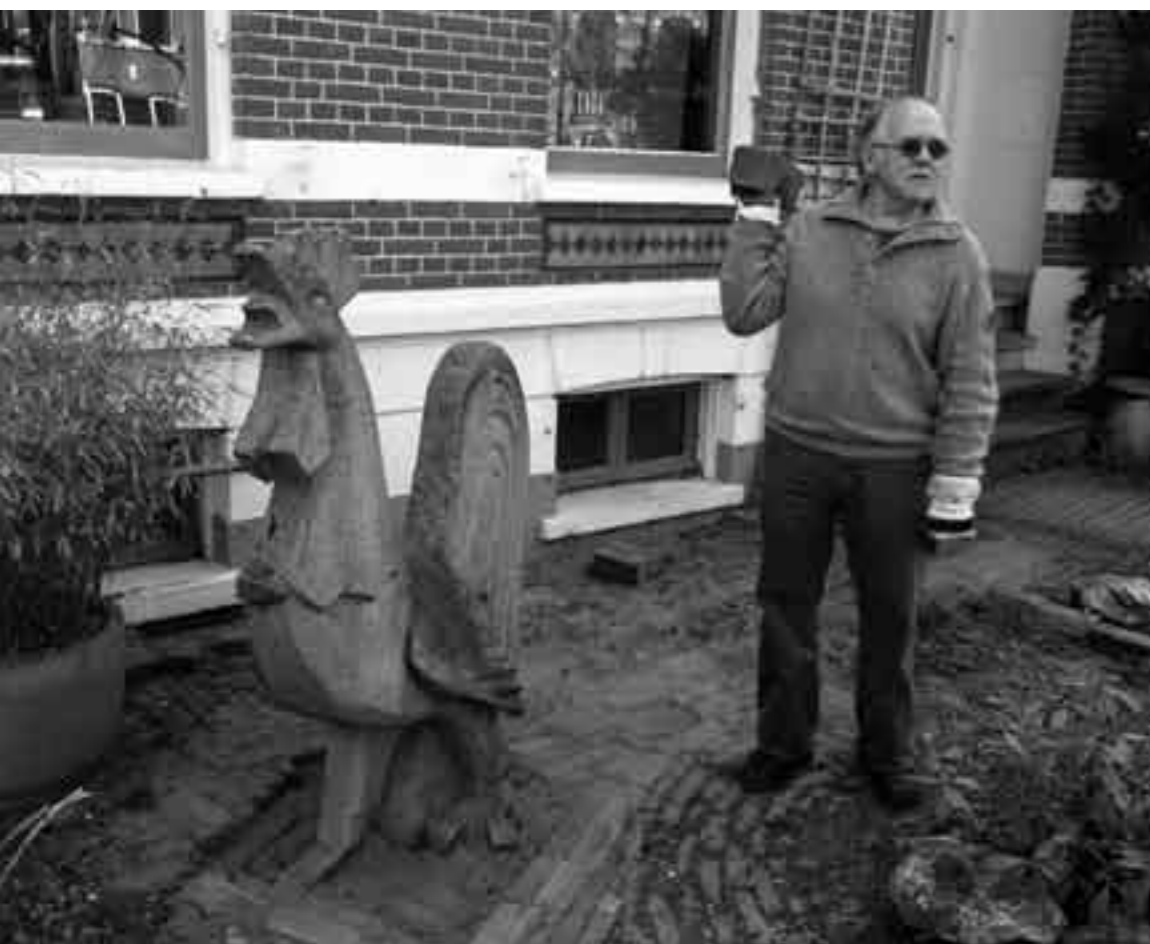
Om de haan te vervoeren was een flinke vrachtwagen nodig

Eén van de twee granieten hanen die ooit het gebouw van Het Vrije Volk en de Geldlander aan het Gele Rijdersplein tooiden, is verzeild geraakt in de voortuin van een bewoner aan de Boulevard Heuvelink. Daar, naast garage Zijm, staat het stenen beest sinds 9 april. Dat is te danken aan het feit dat het pand De Opbouw aan de Velperweg, ooit met bewoners als NVV, FNV en Nivon 'het rode bastion' genoemd, sinds kort is verlaten door de Stichting Rijnstad.