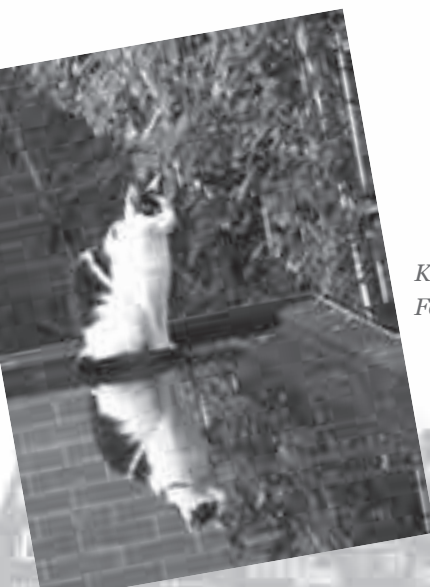
Kat van Parkstraat 44.

Schrijf een briefje met daarop "WIJKKRANT BEZORGING", je naam en adresgegevens, en doe dat bij De Lommerd in de brievenbus. Wij nemen dan contact met je op.