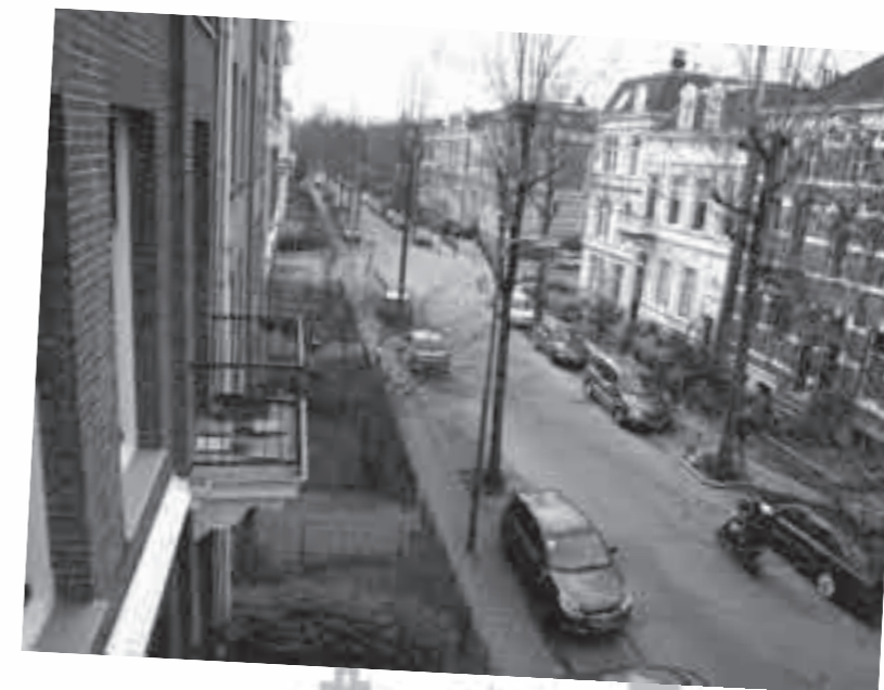
Foto 2 vanaf balkon Parkstraat 66 in maart 2010

Foto 1 van de Parkstraat, omstreeks 1880, met rechts een deel van landgoed Gelders Spijker, foto uit het archief van Arnhem.