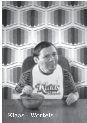
Klaas - Wortels

Elke laatste maandagavond van de maand is er om 18.00 uur een open maaltijd. Gezellig met elkaar eten voor een zeer gering bedrag. Graag tevoren aanmelden.